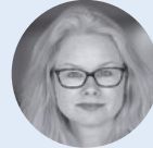
Dr. Kirsten Kappert-Gonther, MdB Stellv. Vorsitzende im Gesundheits- ausschuss des Deutschen Bundes- tages (Bündnis 90/Die Grünen)