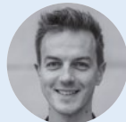
Matthias Mieves, MdB Mitglied im Gesundheits- ausschuss des Deutschen Bundestages (SPD)