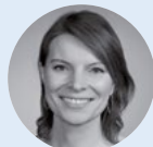
Emmi Zeulner, MdB Mitglied im Gesundheits- ausschuss des Deutschen Bundestages (CDU/CSU)